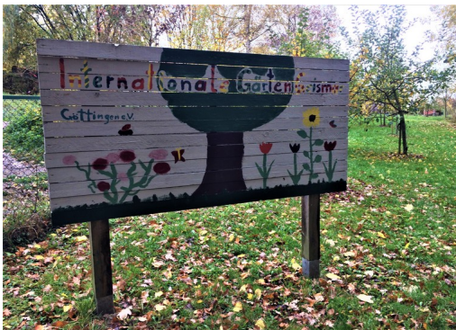
Gemeinschaftsgarten in Geismar