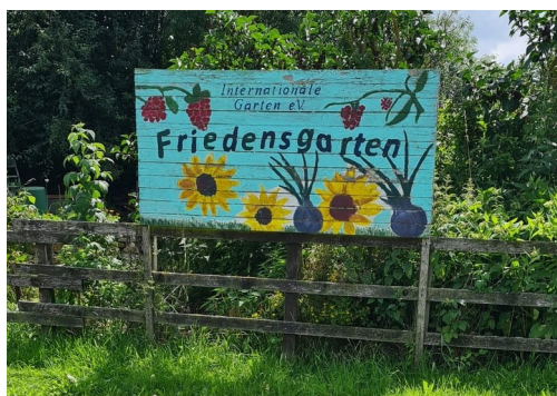
Friedensgarten in Gronne